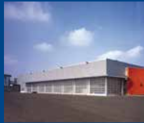
BRANCH - SOMBREFFE garage - warehouse

BRAEM NV Handzaamse Nieuwstraat 7 8610 Handzame - Belgium T +32(0)51 57 58 58 F +32(0)51 56 72 21 info@braem.com www.braem.com