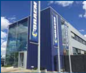
موقع الشركة الرئيسي

BRAEM NV Handzaamse Nieuwstraat 7 8610 Handzame - Belgium T +32(0)51 57 58 58 F +32(0)51 56 72 21 info@braem.com www.braem.com