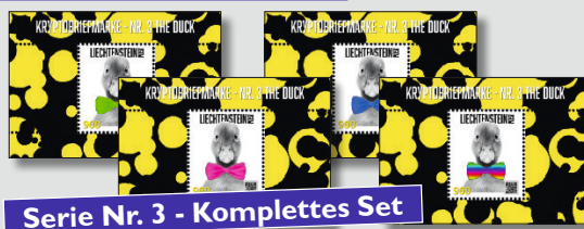
Serie Nr. 3 - Komplettes Set

Fürstentum Liechtenstein + Kryptobriefmarken + Serie Nr. 3 + THE DUCK + 2023 + 4 Sonderblocks + Postfrisch + Fliege GRÜN + Auflage: 1'700 Ex. + Fliege BLAU + Auflage: 1'100 Ex. + Fliege PINK + Auflage: 750 Ex. + Fliege REGENBOGEN + Auflage: NUR 50 Ex.