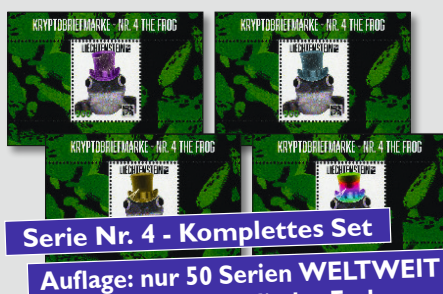
Serie Nr. 4 - Komplettes Set

Auflage: nur 50 Serien WELTWEIT mit allen vier Zylinder-Farben