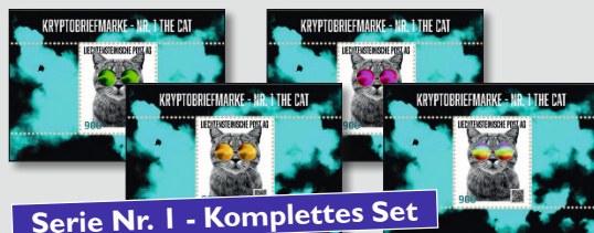
Serie Nr. 1 - Komplettes Set

Fürstentum Liechtenstein + Kryptobriefmarken + Serie Nr. 1 + THE CAT + 2022 + 4 Sonderblocks + Postfrisch + Sonnenbrille GRÜN + Auflage: 1'400 Ex. + Sonnenbrille ROSA + Auflage: 900 Ex. + Sonnenbrille GOLD + Auflage: 650 Ex. + Sonnenbrille REGENBOGEN + Auflage: NUR 50 Ex.