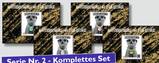
Serie Nr. 2 - Komplettes Set

Fürstentum Liechtenstein + Kryptobriefmarken + Serie Nr. 2 + THE MEERKAT + 2023 + 4 Sonderblocks + Postfrisch + Halskette BLAU + Auflage: 1'400 Ex. + Halskette KUPFER + Auflage: 900 Ex. + Halskette SILBER + Auflage: 650 Ex. + Halskette REGENBOGEN + Auflage: NUR 50 Ex.